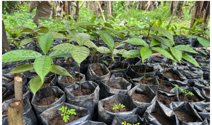
Kweekboompjes bestemd voor herbebossing

Ook de samenwerking met ROGA van de Ngabe in Progreso Comte ontwikkelt zich goed. De cultuurprojecten en het overdragen van de kennis van ouderen aan een nieuwe generatie over bijvoorbeeld de productie van huisraad is een groot succes. De jongeren tonen trots wat ze hebben gemaakt en de belangstelling in de gehele gemeenschap is flink toegenomen.