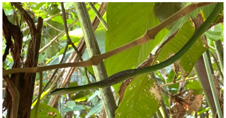
Slang die net een kikker heeft gegeten in een herbebost stuk oerwoud