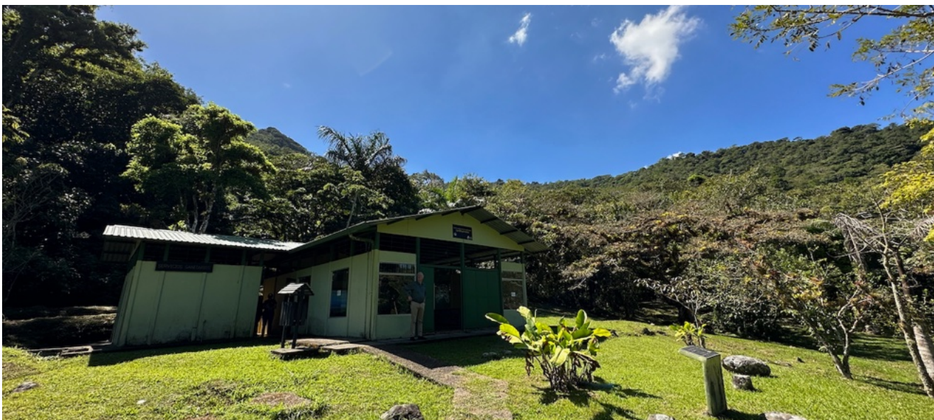
Het bezoekerscentrum van Madre Verde met op de achtergrond de door hen herbeboste vallei

Dit betekent dat Madre Verde in Palmares programma's heeft opgestart om het zwerfvuil te bestrijden. Er is niet alleen heel veel opgeruimd, maar ook het besef van de bewoners dat het anders moet is een zichtbaar resultaat. De recycling van de verzamelde flessendoppen in rijplaten, waardoor delen van het bos nu ook voor gehandicapten bereikbaar zijn, is geslaagd.