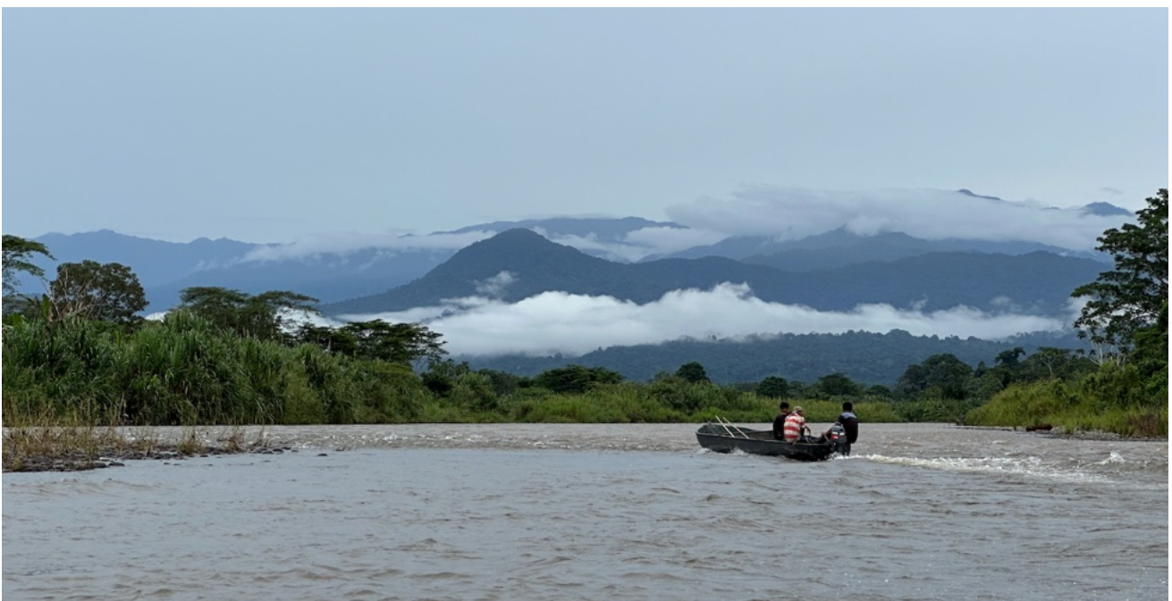
Onderweg naar Suretka, in het gebied van de Bribri met in de verte het Talamanca gebergte

De gemeenschap in Boruca praten een lokaal dialect, Brunca. De taal wordt steeds minder gesproken en dreigt uit te sterven. De gemeenschap wil nu een scholingsprogramma opzetten om de taal te onderwijzen en die zo levend te houden. Voor onderzoek en het ontwikkelen van lesmateriaal en transport wordt aan het ITF een bijdrage gevraagd van 6287 euro .