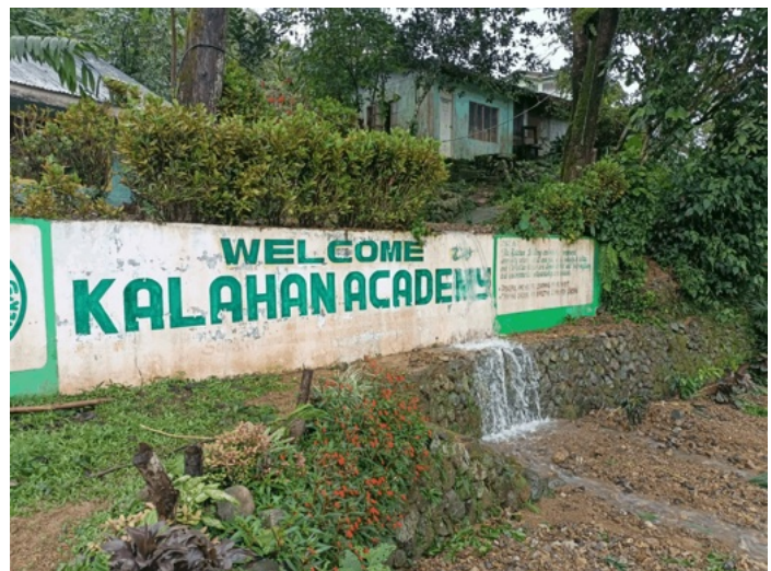
Naweeën van de overstromingen bij Kalahan Academy

Imugan werd echter getroffen door de zware tyfoon Fung-Wong. De Kalahan Academie werd overstroomd door water en modder, terwijl wegen, bruggen en infrastructuur werden verwoest. Het dorp raakte geïsoleerd en voorzieningen zoals elektriciteit en voedselverwerking waren aangetast. Het Bossen Nood Fonds heeft direct financiële steun verleend en meegeholpen een snelle fondswervingscampagne te mobiliseren.