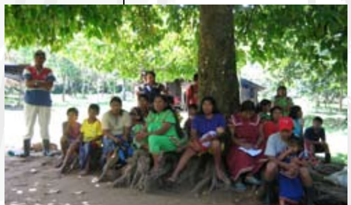
Dorpelingen in Conte Burica verzameld rond de 'vergaderboom'.