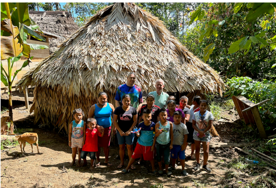
Vrouwengroep met vrijwilligers van het ITF in Talamanca