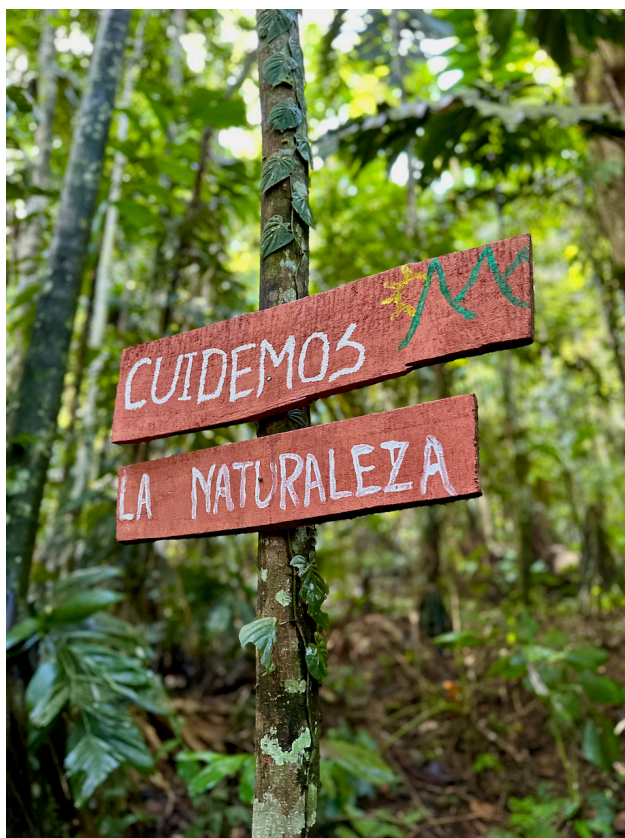
Bord in Talamanca, bij een gebied wat met steun van het ITF wordt beschermd: 'Wij zorgen voor de natuur'

In Talamanca zien we dat een nieuwe generatie onze projecten met interesse heeft gevolgd en nu zelf soortgelijke projecten wil opzetten en uitvoeren. In een traditioneel gemeenschapshuis waaraan wij hebben bijgedragen, worden jonge mannen opgeleid tot awa's (medicijnmannen). We voerden gesprekken met de leiders van diverse clans waarin we benadrukken dat we het belangrijk vinden dat zij hun eigen besluiten nemen. Onze rol is slechts het mogelijk maken van projecten. We kijken met tevredenheid terug op deze gesprekken en de resultaten die we hebben gezien.