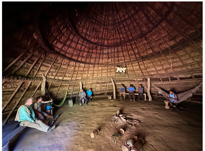
Gemeenschapshuis met Awá (medicijnmannen) in Talamanca

Grupo Sëña is een gemeenschap waar drie families gezamenlijk 1,5 hectare willen herbeplanten met nuttige bomen en medicinale planten. Steeds weer blijkt uit gesprekken en eerdere projecten dat het helpt om de plantages dicht bij de gemeenschappen te hebben. Hierdoor blijft het gebruik beter gewaarborgd en wordt de kennis over de planten makkelijker overgedragen. We willen hen graag steunen met 2183 euro .