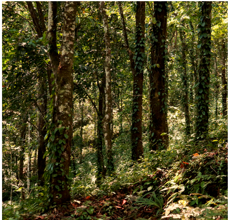
Bomen in Finca Pejibaye, waar veel certificaatbomen geplant zijn.

U kunt de boomcertificaten bestellen via www.itf.nl , of bij het secretariaat.