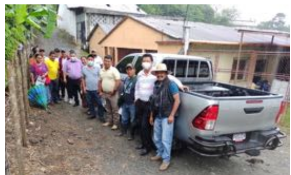
CGTG met de nieuwe auto op bezoek bij zijn leden

Vanwege corona konden wij dit jaar niet naar Guatemala reizen, hopelijk is dat binnen afzienbare termijn wel mogelijk.