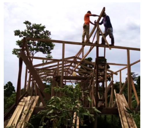
De Cabecar bouwen met hulp van het ITF