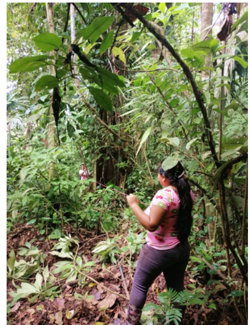
Bribri uit Bajo Coén meten het nieuwe land

Tot slot heeft de educatieve film van gesprekken met Bribri medicijnmannen (Awah's) die wij vorig jaar hebben geholpen te produceren veel succes in de gemeenschappen. Er is een publieks- en een vertrouwelijke versie gemaakt – in de laatste worden geheimen van de cultuur besproken. De publieksversie is ook op onze website www.itf.nl te bekijken.